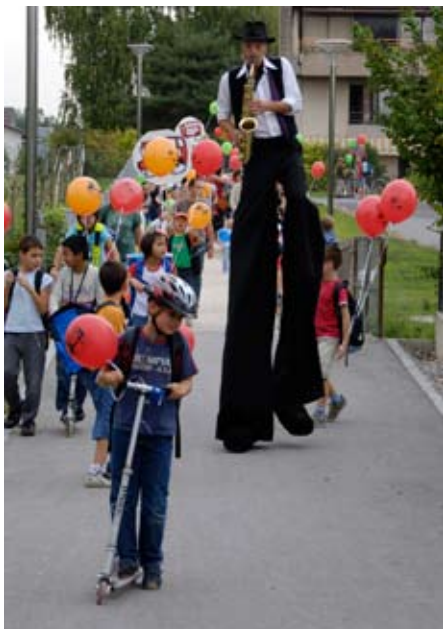
Baisse de l'accompagnement en voiture. Les campagnes de sensibilisation commencent à porter leurs fruits (ici à Satigny GE en 2006).

La mauvaise nouvelle ensuite. Bien que 84% des jeunes Suisses possèdent une bicyclette, la part modale de la pratique du vélo des jeunes a été divisée par deux en onze ans. Elle devient très faible en Romandie avec seulement 2% environ de jeunes qui se déplacent à vélo.