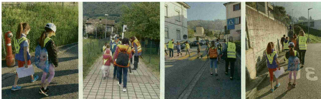
Nelle foto Pedibus a Riva San Vitale e Vacallo.