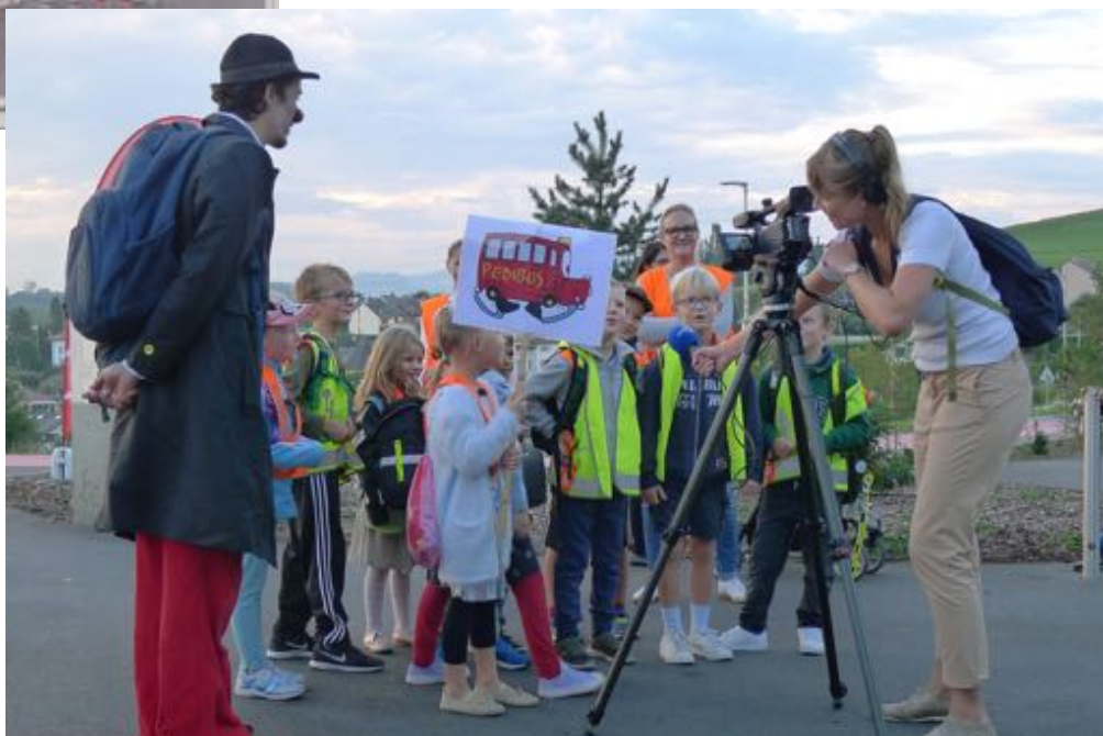
JIAP, ligne La Croix, Granges-paccot