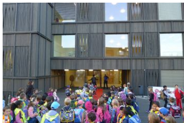
JIAF, Granges-paccot

Une conférence de presse a eu lieu dans la matinée, alors que des classes visitaient le parcours d'agilité mis à disposition par la Police cantonale dans la cour de l'école.