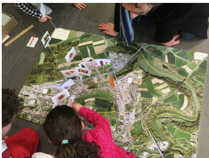
Samedi des bibliothèques, Granges-Paccot