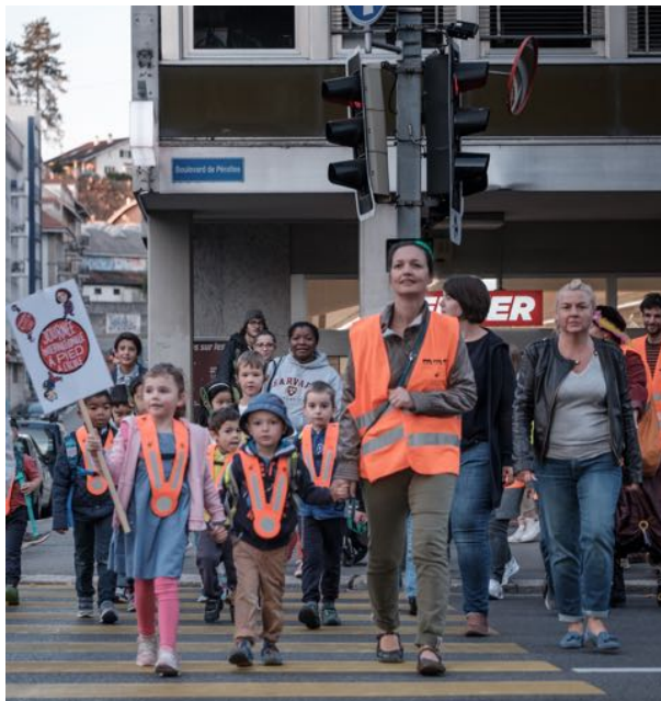
JIAP, Ligne Rue de Locarno, Fribourg

La sécurité est également centrale dans la démarche du Pedibus. Avec le Pedibus, les enfants intègrent, sous la vigilance d'un adulte, les règles de sécurité et de comportement dans les déplacements à pied. Ils acquièrent petit à petit de l'autonomie et pourront à terme se déplacer seuls, en sécurité.