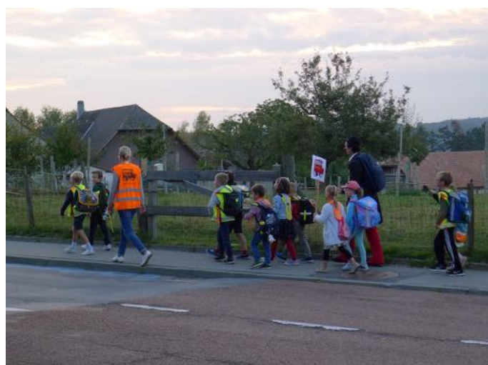
JIAF, ligne La Croix, Granges-paccot ©ATE