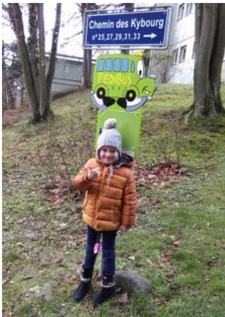
Ligne des Kybourg, Fribourg