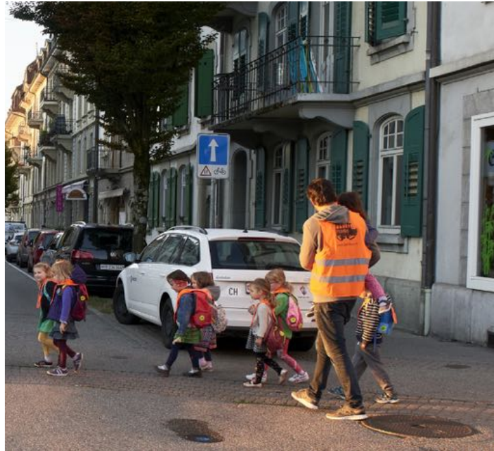
Ligne Alt-Bourg à Fribourg

Le Pedibus repose sur l'engagement des parents qui créent et font fonctionner la ligne. Ils en déterminent le tracé, les arrêts, les horaires et le règlement selon leurs besoins et se relaient pour assurer l'accompagnement des enfants. Un parent assure le rôle de personne de référence pour la ligne.