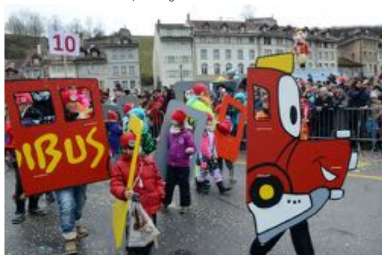
Carnaval des Bolzes, Fribourg