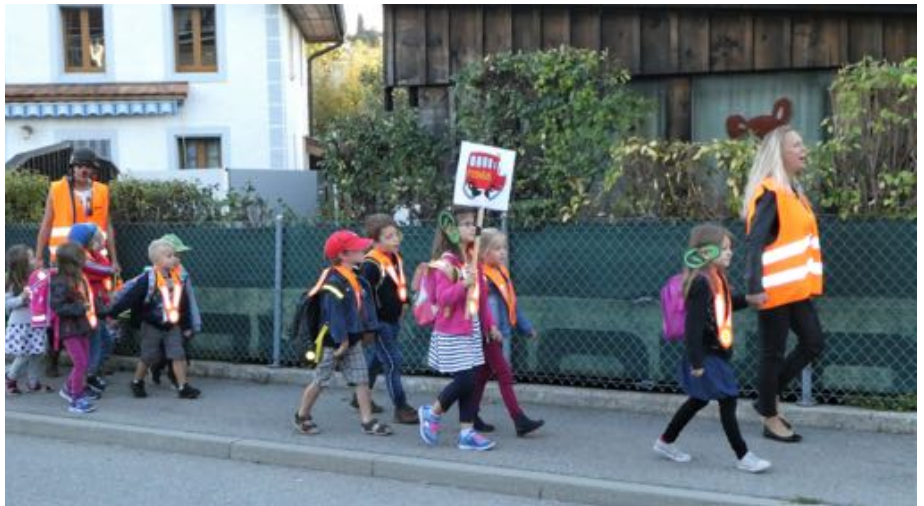
JIAP, Le Mouret

Ainsi, 81 lignes sont actives cette année scolaire 2018-19 , dont 18 nouvelles lignes.