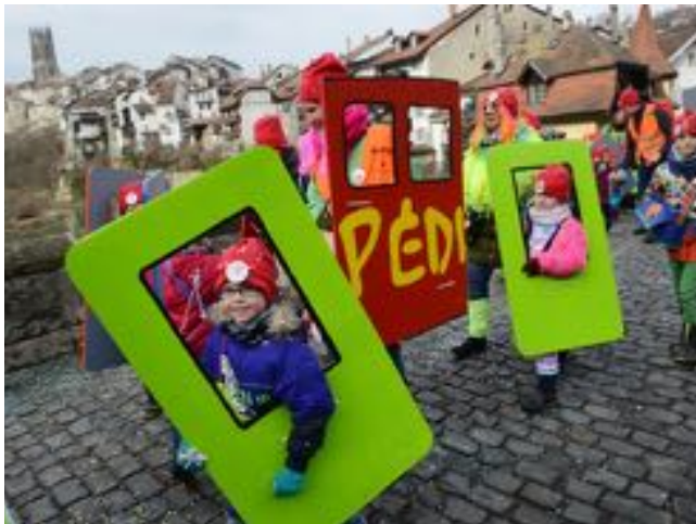
Carnaval des Bolzes, Fribourg

Sous la pluie, c'est chouette aussi! A l'automne 2018, tous les enfants des lignes Pedibus ont reçu une pèlerine.