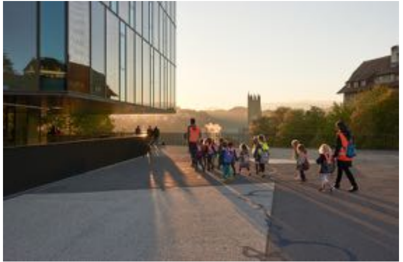
Ligne Alt-Bourg, Fribourg

L'impact positif du Pedibus sur les liens sociaux renforcés dans les quartiers, encourageant l'échange et l'entraide entre familles me réjouit également beaucoup. Les premières expériences d'intégration de seniors ou de familles nouvellement installées promettent encore de belles et riches rencontres.