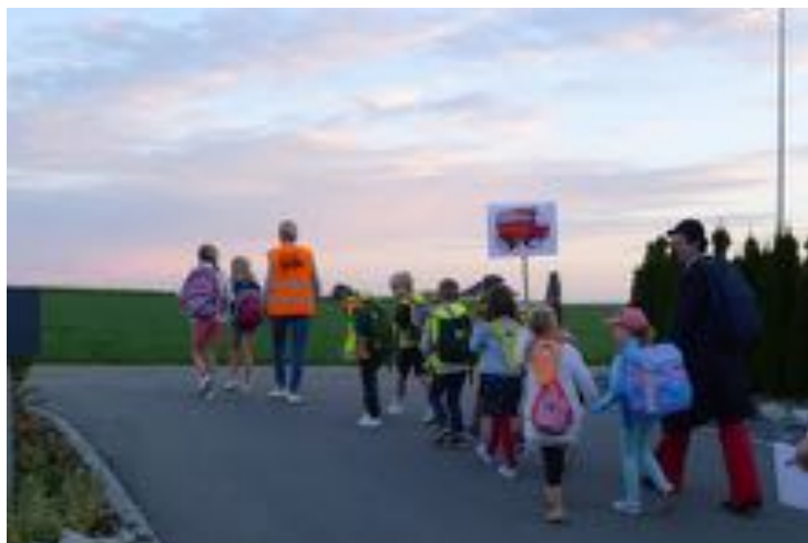
JIAP, ligne La Croix, Granges-paccot

Villars-sur-Glâne > 6 lignes, dont 2 nouvelles