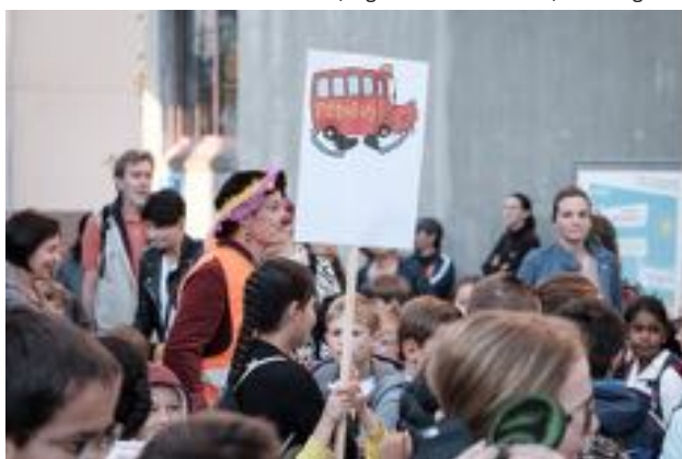
JIAF, Fribourg