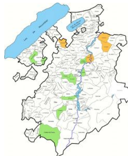
Etat décembre 2010

2009-2010: 12 2010*-2011: 21 2011-2012: 30 2012-2013: 42 2013-2014: 43 2014-2015: 50 2015-2016: 49 2016-2017: 73 2017-2018: 75 2018-2019: 81