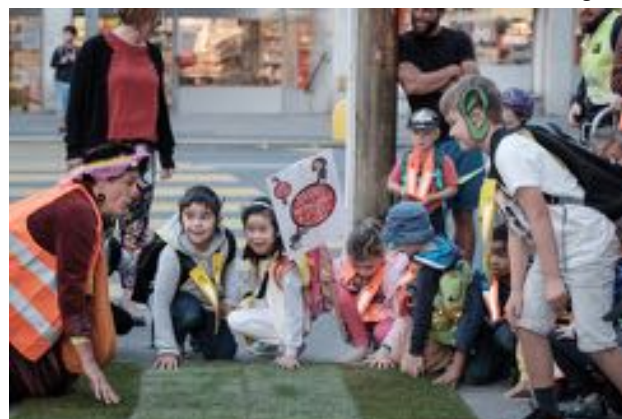
JIAF, Fribourg