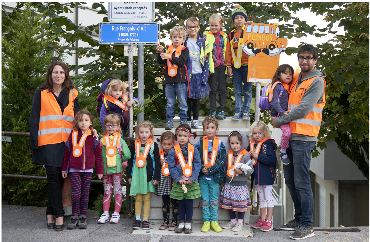
Ligne Alt-Bourg à Fribourg