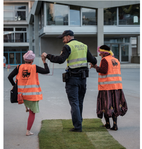
JJAP, Fribourg ©JJAP

Une ligne Pedibus a été fêtée pour accompagner le lancement de la campagne en septembre (voir p.17).