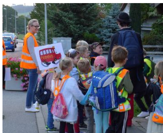
JIAP, ligne La Croix, Granges-paccot

Divers actions ont été menées dans les communes de l'Agglomération: