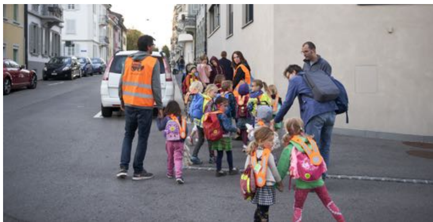
Ligne Alt-Bourg, Fribourg

> Le journal communal 1700 a fait paraître un article d'information générale dans le bulletin du mois de septembre.