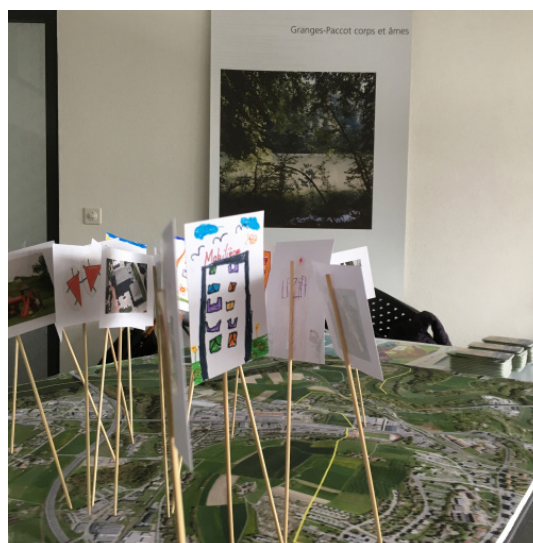
Samedi des bibliothèques, Granges-Paccot