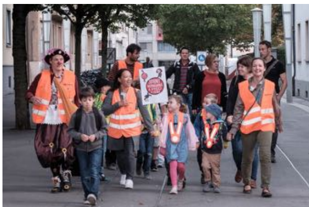
JIAF, Ligne Rue de Locarno, Fribourg