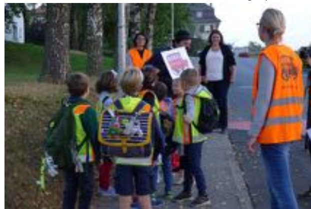
JIAF, ligne La Croix, Granges-paccot