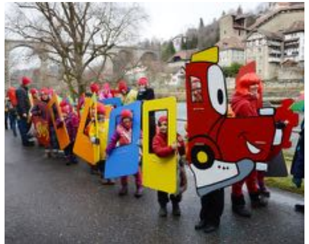
Carnaval des Bolzes, Fribourg