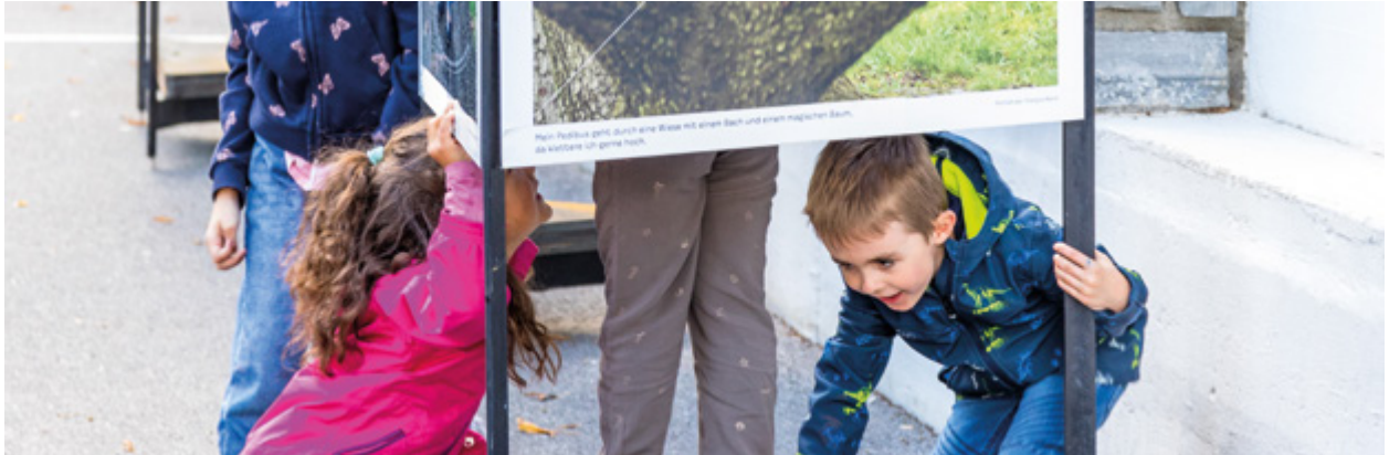
Pedibus-Ausstellung in Martinach-Bourg

Die Koordination Pedibus Wallis unternimmt Kommunikations- und Werbeanstrengungen auf mehreren Ebenen, um die Eltern und Partnerinstitutionen jedes Jahr aufs Neue zu sensibilisieren. Dieses Vorgehen ist für die Entwicklung neuer Pedibus-Linien zentral.