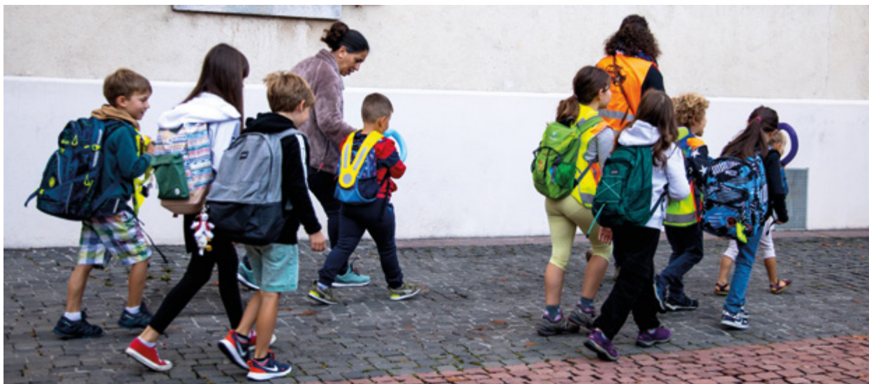
Unterwegs mit dem Pedibus in Martinach